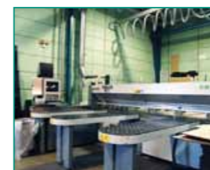
SELCO EB 95 sav (finér/træ/plast) 3,8 x 3,2m x 80mm med optimering