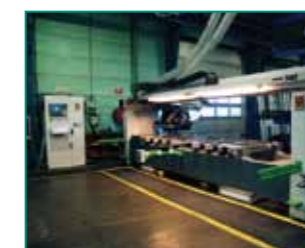
BIESSE ROVER 342 CNC bearbejdningscenter